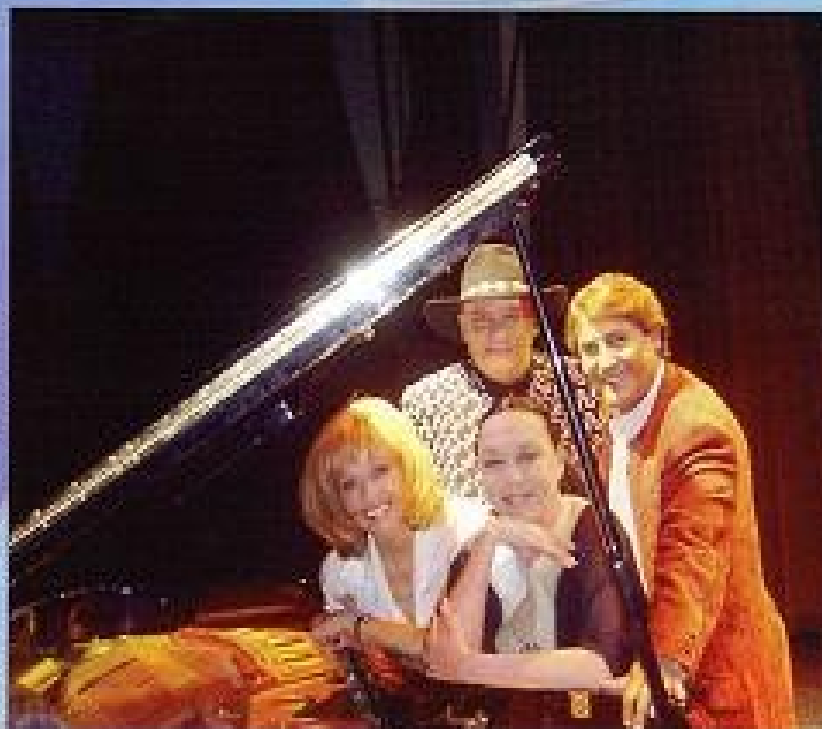
HOMENAJE A CECILIA Y NINO BRAVO

01:00 VERBENA con la Orquesta Continente en la Herriko Plaza.