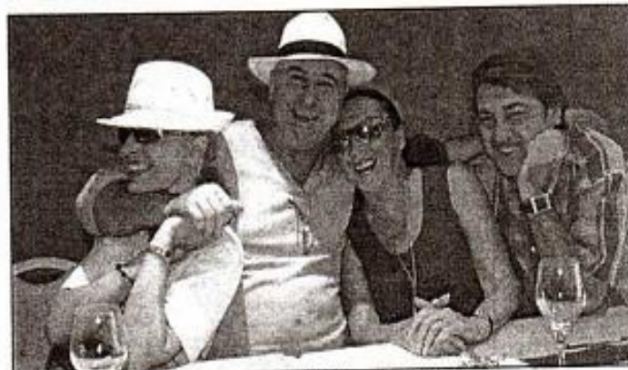
Imágenes de la rueda de prensa celebrada ayer en el Hotel Hesperia de Puerto Calero.

"Estrellas de Siempre" es un espectáculo muy dinámico en el cual el público, tanto el más joven como el mayor, conoce todas las canciones y las tararea